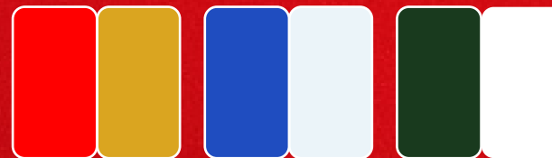
Vermelho e dourado

Use as suas cores favoritas como base para a escolha como bolinhas, almofadas e outros enfeites que farão parte da sua decoração: